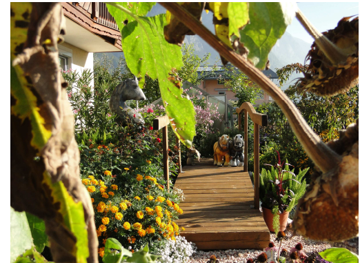
Garten Fam. Hauser