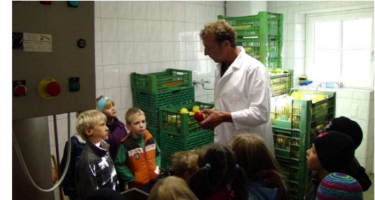
Hr. Hacket mit Volksschulkinder